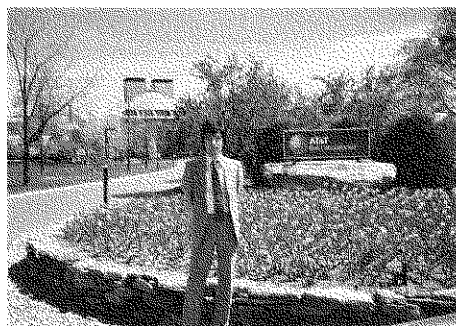
AT & T ベル研前にて